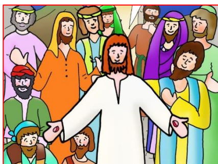
(Luca 24, 44 – 49A)